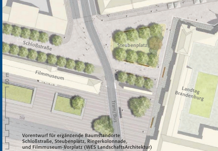
Vorentwurf für ergänzende Baumstandorte Schloßstraße, Steubenplatz, Ringerkolonnade, und Filmmuseum-Vorplatz (WES LandschaftsArchitektur)