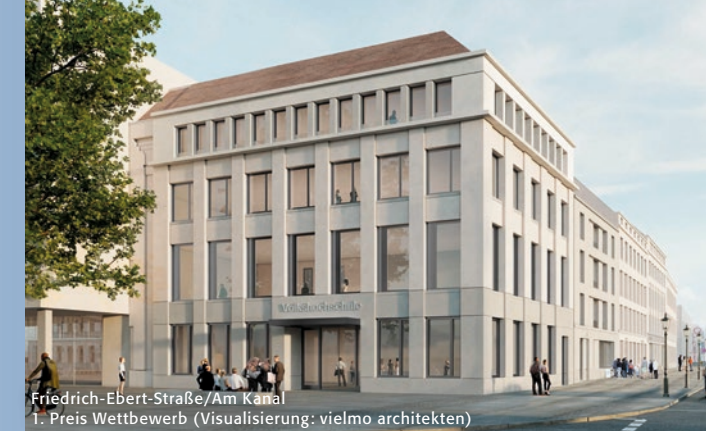
Friedrich-Ebert-Straße/Am Kanal 1. Preis Wettbewerb (Visualisierung: vielmobil architekten)