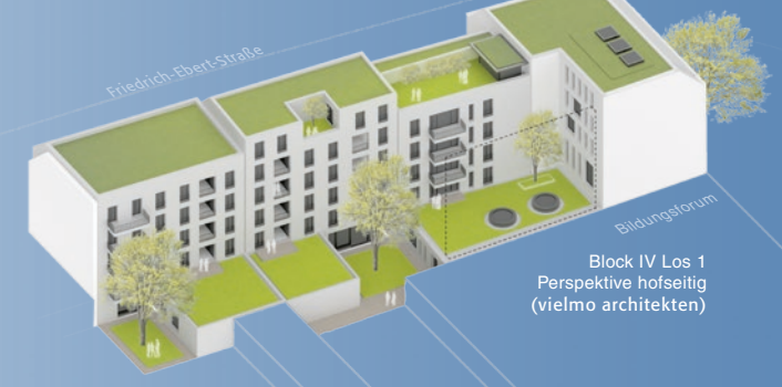
Block IV Los 1 Perspektive hofseitig (vielmobil architekten)

Um für diese Bauaufgabe eine architektonisch anspruchsvolle Lösung zu entwickeln, die kulturellen, sozialen, ökologischen und nachhaltigen Anforderungen gerecht wird, hat die ProPotsdam den Realisierungswettbewerb „Vier Häuser an der Friedrich-Ebert-Straße im Block IV Potsdamer Mitte“ ausgeschrieben. Insgesamt wurden zwölf Arbeiten eingereicht und von einer Fachjury bewertet. Die Preisgerichtssitzung fand am 5. Mai 2023 statt. Der Siegerentwurf stammt vom Berliner Büro vielmobil architekten, welches nunmehr die Hochbauplanung erarbeitet. Ein Bauantrag soll 2024 eingereicht werden. Mit einem Baustart rechnet die ProPotsdam derzeit im Sommer 2025.