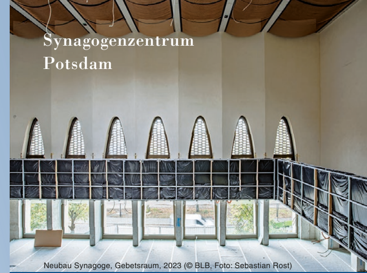
Neubau Synagoge, Gebetsraum, 2023

Nach der Zerstörung im Zweiten Weltkrieg durch die Nationalsozialisten und den späteren Abriss der Potsdamer Synagoge am heutigen Platz der Einheit fand jüdisches Leben sehr lange nicht öffentlich statt. Mit dem neuen Haus können jüdische Gemeinden nun ihre teils Jahrzehnte andauernden Provisorien verlassen.