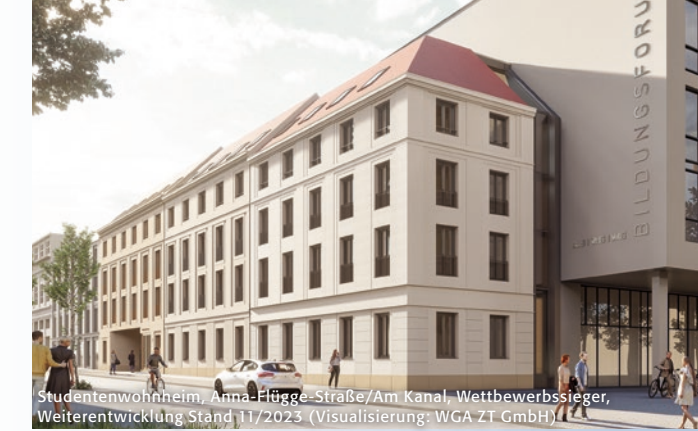
Studentenwohnheim, Anna-Hügge-Straße/Am Kanal, Wettbewerbsieger, Weiterentwicklung Stand 11/2023 (Visualisierung: WGA ZT GmbH)

Kartengrundlagen: Potsdam-Stadtkarten M 1:600 Einzelprojekt-Pläne der Architekten, historische Linien nach Dt. Städteatlas/Potsdam Tafel 3 Karte/Montage/Zeichnung: A. Stadler © 2024 Sanierungsträger Potsdam GmbH