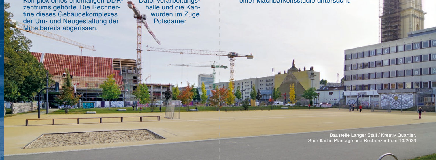
Baustelle Langer Stall / Kreativ Quartier, Sportfläche Plantage und Rechenzentrum 10/2023

In unmittelbarer Nachbarschaft zum wiedererrichteten Garnisonkirchturm und auf einem Teil des ehemaligen Kirchenschiffs steht das temporär bis 2025 als Kunst- und Kreativhaus genutzte „Rechenzentrum“, ein 1971 fertiggestellter Beton-Stahlskelettbau, welcher zu einem größeren Komplex eines ehemaligen DDR-Datenverarbeitungszentrums gehörte. Die Rechnerhalle und die Kantine dieses Gebäudekomplexes wurden im Zuge der Um- und Neugestaltung der Mitte bereits abgerissen.