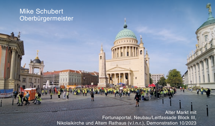
Alter Markt mit Fortunaportal, Neubau/Leitfassade Block III, Nikolaikirche und Altem Rathaus (v.l.n.r.), Demonstration 10/2023