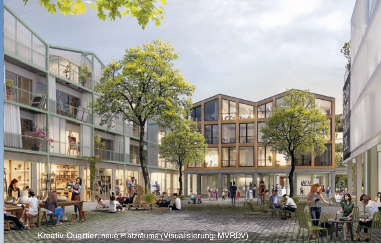
Kreativ Quartier, neue Platzräume (Visualisierung: MVRDV)

Die Kulturschaffenden haben den bestehenden Standort Rechenzentrum etabliert und fordern den Erhalt. Im Juni 2020 wurde durch Beschluss der Stadtverordnetenversammlung ein vier Phasen umfassendes Verfahren gestartet, um ein inhaltliches und gestalterisches Konzept für den Bereich des ehemaligen Kirchenschiffs der Garnisonkirche und des Rechenzentrums zu erarbeiten. 2021 wurde ein inhaltliches Konzept für die Umsetzung eines „Forums an der Plantage“ erarbeitet, welches den wiedererrichteten Kirchturm, den Standort des ehemaligen Kirchenschiffs als „Haus der Demokratie“ und einen weitgehenden oder vollständigen Erhalt des Rechenzentrums als soziokreatives und gemeinwohlorientiertes Zentrum einbezieht.