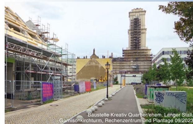
Baustelle Kreativ Quartier/ehem. Langer Stall, Garnisonkirchturm, Rechenzentrum und Plantage 09/2023

Die Stiftung Garnisonkirche Potsdam als Betreiberin schafft im Turm ein breites Angebot aus Bildungsprogrammen, Konzert- und Diskussionsveranstaltungen sowie Raum für Andachten, Gottesdienste und Seminare. Im dritten Obergeschoss entsteht eine Dauerausstellung zum Thema „Glaube, Macht und Militär“. Historische Wegmarken und Hintergründe deutscher Geschichte werden hier ebenso thematisiert wie aktuelle gesellschaftspolitische Diskurse. Zu den Highlights gehören die modern gestaltete Kapelle im Mittelpunkt des Turmsockels mit ihren beiden Orgelwerken der traditionsreichen Firma Schuke mit Wurzeln im Holländischen Viertel sowie die Aussichtsplattform in 57 Metern Höhe. Sie ist mit einem Aufzug barrierefrei erreichbar und bietet einen großartigen Blick über das in die Wasser- und Parklandschaft eingebettete Potsdam.