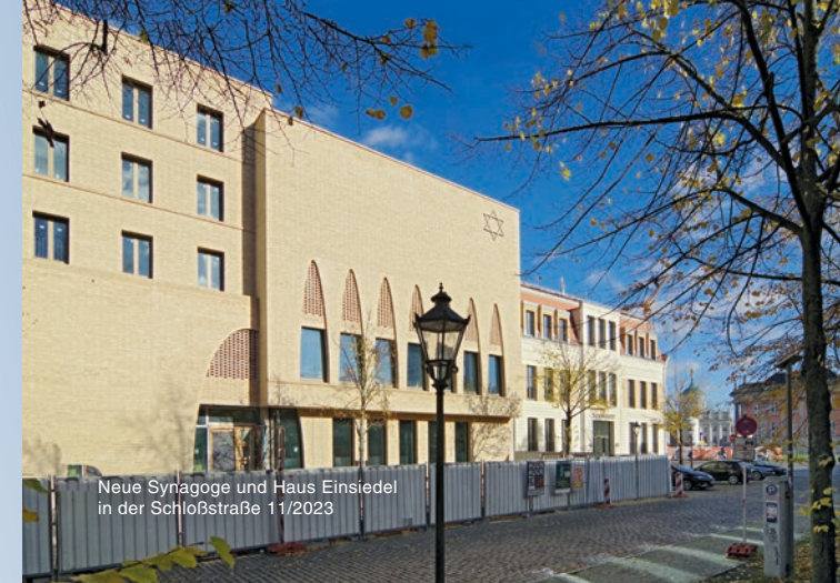
Neue Synagoge und Haus Einsiedel in der Schloßstraße 11/2023

Der Grundstein für den Neubau wurde am 8. November 2021 gelegt und am 26. August 2022 das Richtfest gefeiert. Ab dem Sommer 2024 öffnet die neue Synagoge ihre Türen.