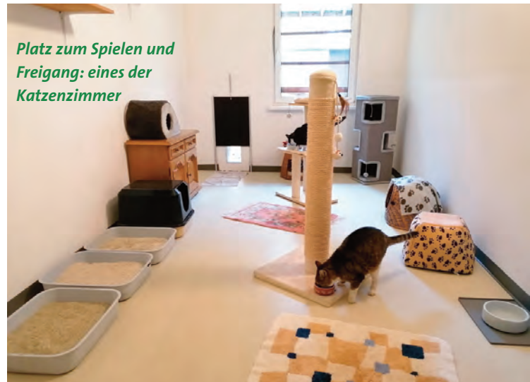
Platz zum Spielen und Freigang: eines der Katzenzimmer