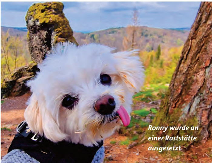
Ronny wurde an einer Raststätte ausgesetzt

Die viele Arbeit macht der Tierfreundin nichts aus. Für sie ist es eine erfüllende Tä-