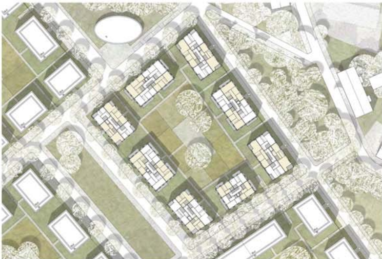
Legende Alternative M 1:500