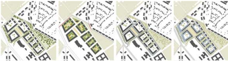
Bestehende Bäume werden erhalten und ergänzt. Die vorhandenen Alleenbäume definieren die Baufelder. Private Grünflächen: Vorgartenbereiche sowie Gemeinschafts- und den Wohnungen zugehörigen Gärten und Gemeinschaftsflächen. Abkantung an das bestehende Straßennetz, Durchwegung des großen Blocks mit Einseitstraßen. Öffentliche Grünplätze entlang der Straßen, Private Grünplätze für das Wohnen (gen. Fußgängerüberwegung in Gärten, die um die 7m aus dem Gebäude herausragen sind, Grünplätze für das Gewerbe an der Heinrich-Mann-Allee entlang der Straße sowie in Fußgängerwegen.