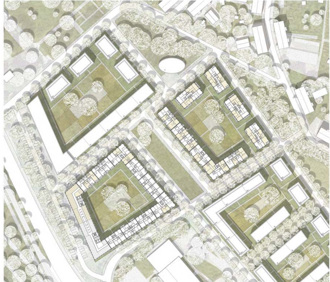
Legende Alternative M 1:500